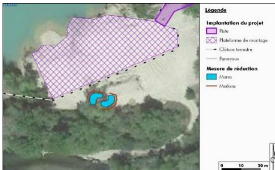
Figure 1: Carte de localisation des mares à créer en application de la mesure MR 5 (Artifex)

La carte ci-dessous permet de localiser les mares qui seront créées par rapport au plan de masse du projet.